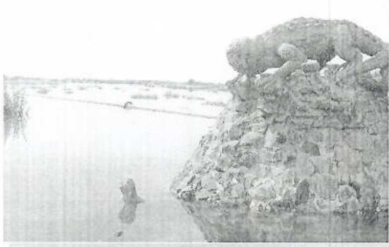
Caño de las mujeres en Plato. Tomado de http://deracamandaca.com/?p=48876

Lo que come ese caimán, es digno de admiración Lo que come ese caimán, es digno de admiración Come queso y come pan, y toma tragos de ron”